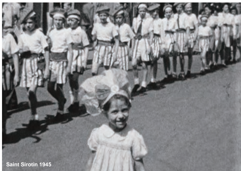
Saint Sirotin 1945

Sauvegardez vos films ! Participez à la mémoire de Sours et de ses environs